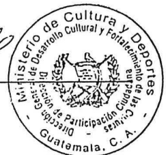
Firma y sello de la Autoridad que Evalua los Servicios (según Clausula de contrato: Décima Primera)